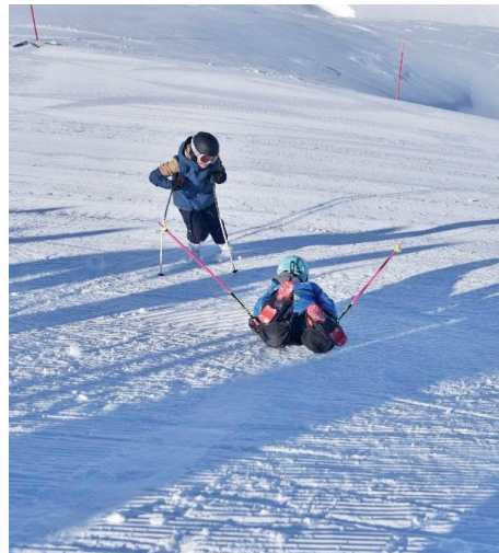
Einwärmen resp. Einrutschen vor dem Start...