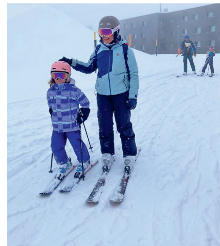
Kleine und grosse Teilnehmende