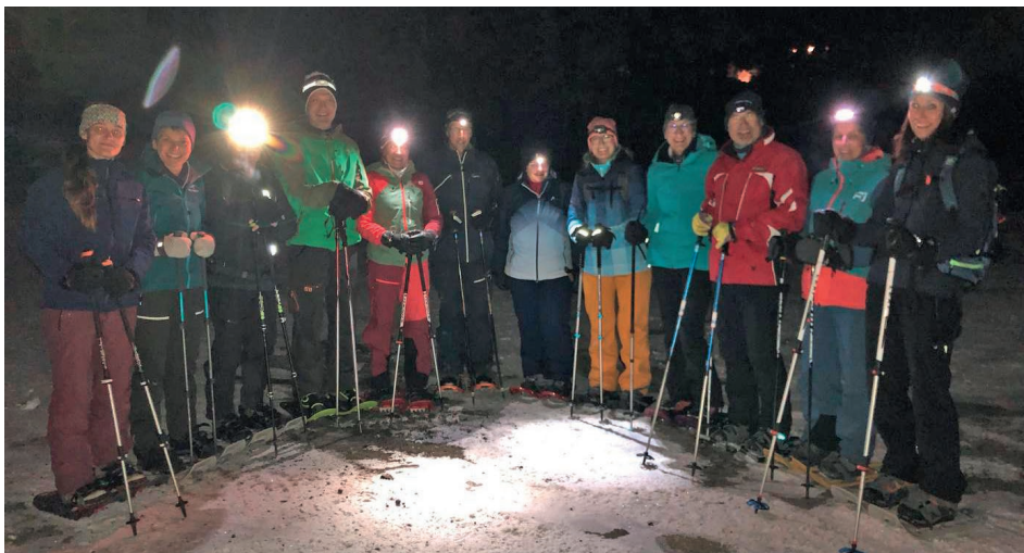
Teilnehmer der Schneeschuhtour