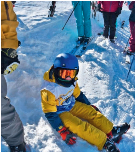
Konzentration vor dem Start...