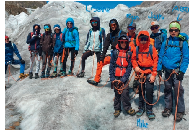
Gruppenfoto von allen Teilnehmenden einer Eiswanderung

Auch unser Snowcamp konnte wieder wie gewohnt stattfinden und nach meiner Meinung hatten die Kids wieder viel Freude mit uns eine Woche auf der Melchsee Frutt zu verbringen. Zumal es zu Beginn des Lagers eine schöne Portion Neuschnee gegeben hat. Wie man Dazumal schon sagte: Neben der Piste lernst du Ski fahren. Vor allem da die Leiter noch ein paar coole Orte mehr kennen als andere Freerider. Zum Abschluss der Saison und meines Rückblickes: Die Saison war wieder mit vielen schönen und erfreudigen Momenten geschmückt und wir hatten stets viel Spass mit den Kids ein paar Stunden im Schnee zu verbringen.