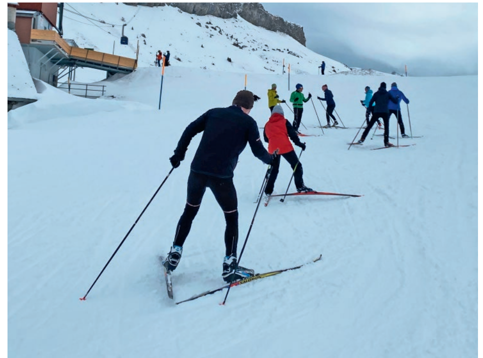
Bild vom Langlaufkurs 2022