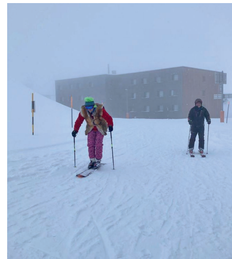
Monoski – gibt es das wirklich noch?